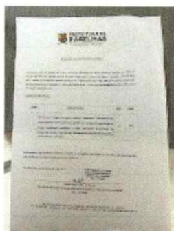
WhatsApp Image 2023-03-29 at 13.13.29.jpeg 209K